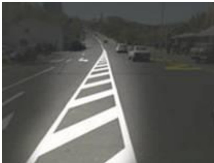
Polja za usmeravanje