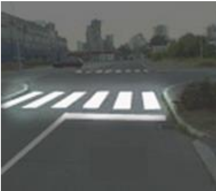
Pesacki prelaz oznacava deo površine kolovoza namenjenog za prelaz pesaka .