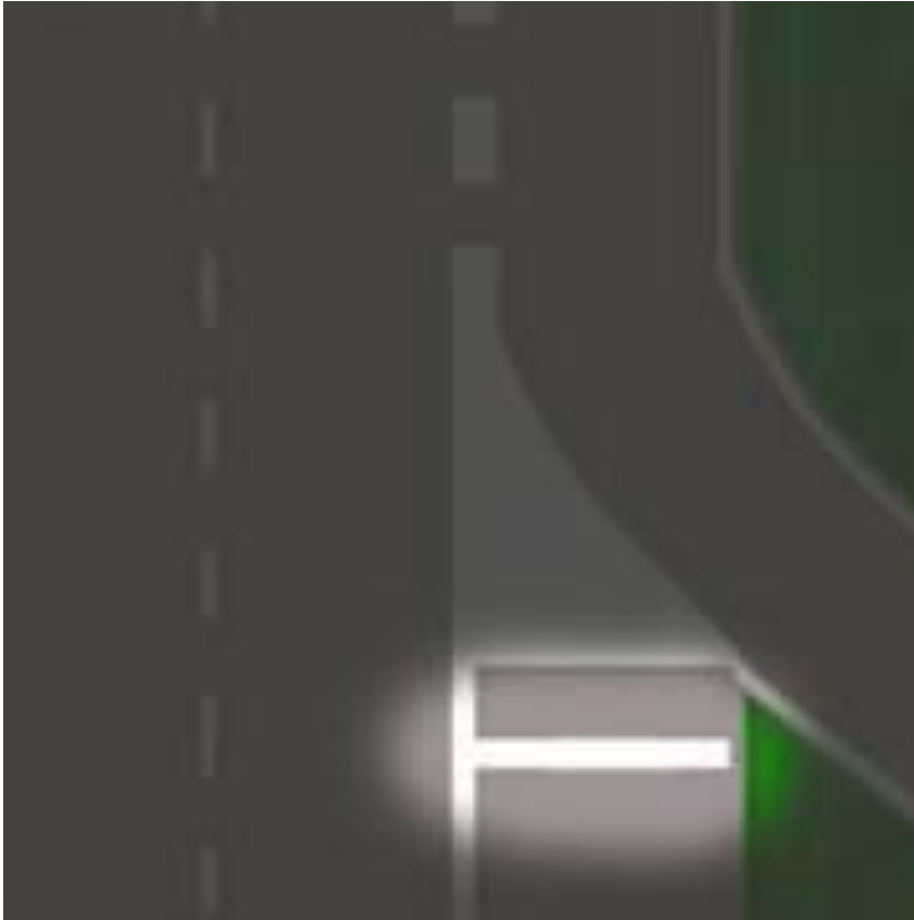
Granicnik oznacava mesto ulivanja gde je potrebno odvojiti deo kolovoza na kome je zabranjen saobraćaj .